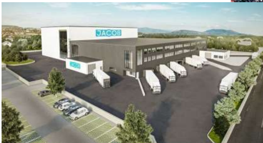
Nowe Centrum Logistyczne – otwarcie 16.10.2018